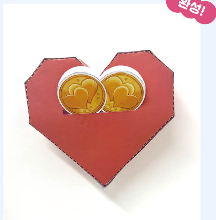
『우정머니를 충전합니다』 금수정 글 · 해랑 그림